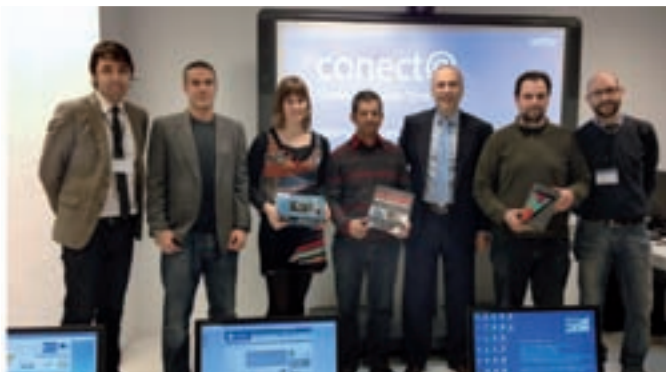
En la imagen de la izquierda, los premiados, junto al concejal de Innovación y el equipo de Conect@. En la de la derecha, la fotografía que ha conseguido el primer premio.