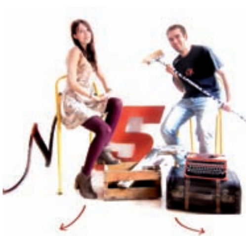
La dirección del blog que han puesto en marcha dos jóvenes de Alcobendas es www.homesapiens.es .

Con el apoyo del Ayuntamiento, este blog llegará al papel con la edición de un libro, en el que los autores esperan que haya "arte, risas y buena literatura a partes iguales". El dinero recaudado con la venta de estos ejemplares se