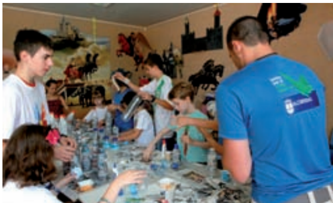
Los niños del campamento 'Jóvenes guardabosques', del Aula de Educación Ambiental, en uno de los talleres.