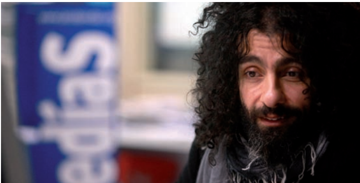
Ara Malikian, en el encuentro digital del pasado lunes.