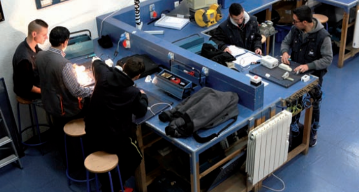
Trabajando en el Centro Norte Joven.

ACTUALIDAD | Un grupo de jóvenes organiza un minitorneo de fútbol sala