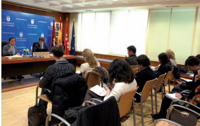
El alcalde y el concejal de Economía y Hacienda, en la presentación de los Presupuestos 2014 a la prensa.

tantos ayuntamientos han suprimido, en un 0,3%.