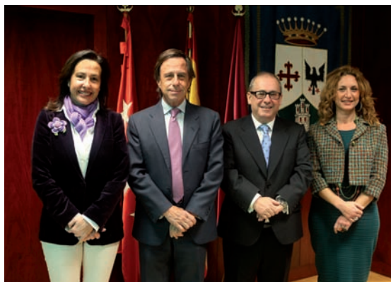
Firmaron el convenio el alcalde y el presidente de AICA acompañados de las concejales de Transporte y Desarrollo Económico.

desde las 7 hasta las 8:35 horas cada 20 minutos, aproximadamente. Al medio día, de 13:30 a 15 h y en horario de tarde desde las 17 hasta las 19:30 horas en el mismo intervalo. Para el Arroyo de la Vega, va desde las 7:20 a las 9:05 horas, cada veinte minutos aproximadamente. Al medio día, desde las 14 a las 15:35 y en horario de tarde desde las 17 a las 19:30 h, con el mismo intervalo.