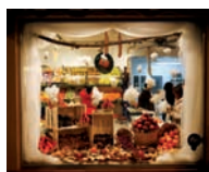
Frutería los Kikes, primer premio de la Cámara de Comercio

Esta Navidad, regálale confianza y calidad