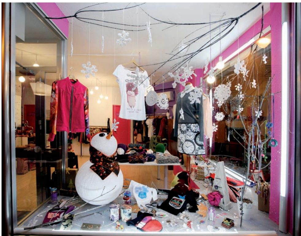
Des-Caro, primer premio del público en el Concurso de Escaparates 2013