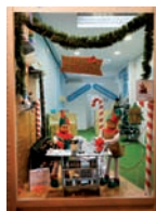
Cloudia, cigarrillos electrónicos, segundo premio de AICA