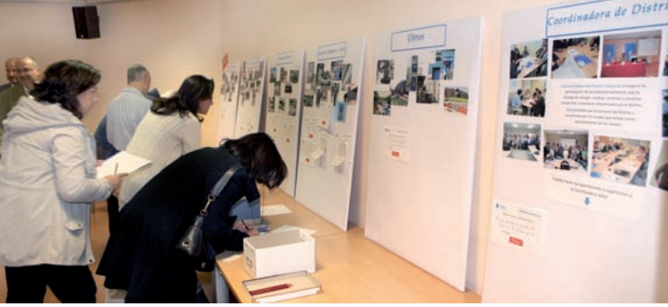
En la imagen superior, vecinos de Centro participando en la asamblea y en la inferior, la asamblea de Distrito Norte.