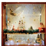
Happy Cupcake, primer premio de AICA