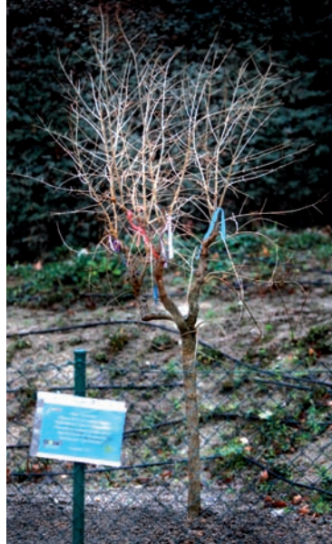
Hace unos días, ASACO plantó un granado en el Centro de Mayores 'Urbanizaciones'.

Hace solo unos días, dentro de la campaña Planta un árbol que está realizando ASACO para concienciar sobre la enfermedad, tuvo