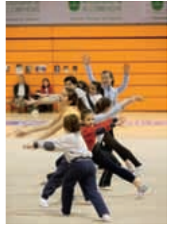
A la izquierda, la campaña de sensibilización del Ayuntamiento sobre la corresponsabilidad en las tareas del hogar. A la derecha, la exhibición de gimnasia rítmica.