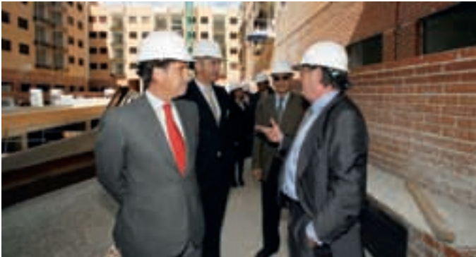
El alcalde, acompañado de varios concejales, visitó las obras de las viviendas el pasado martes.

zado estado de las viviendas que promociona la Empresa Municipal de la Vivienda de Alcobendas ( Emvialsa ) en Fuente Lucha.