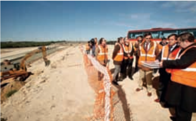
El alcalde y varios concejales visitando el futuro parque empresarial.

El alcalde de Alcobendas, Ignacio García de Vinuesa, ha visitado las obras de urbanización del futuro Parque Empresarial Valdelacasa para acercarse a los trabajos que se llevan a cabo y conocer las características del mismo. Durante el recorrido, ha comprobado el avance de las obras, que estarán terminadas este año.