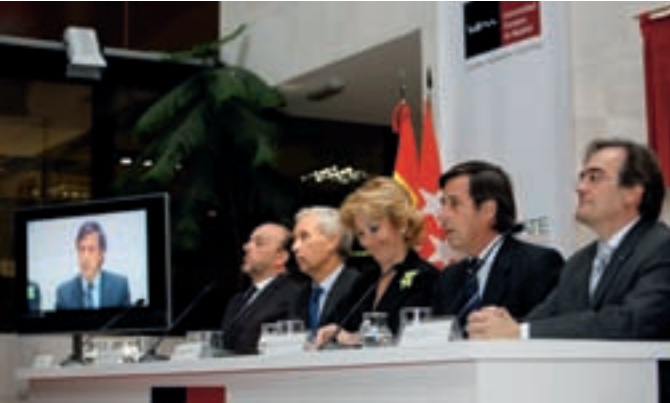
En el centro, la presidenta regional y el alcalde en un momento de la inauguración.

La presidenta de la Comunidad de Madrid, Esperanza Aguirre, y el alcalde de Alcobendas, Ignacio García de Vinuesa, han inaugurado el nuevo Campus La Moraleja de la Universidad Europea de Madrid. El complejo tiene 6.330 metros cuadrados y será la sede de la Escuela de Estudios Universitarios Real Madrid.