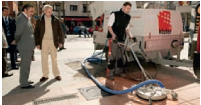
El concejal y el director de Medio Ambiente observan la demostración.

dan sensación de suciedad; por este motivo, ha querido comprobar la eficacia de la máquina no sólo para eliminar los chicles, sino también para limpiar hasta 30 ó 40 centímetros cuadrados de acera.