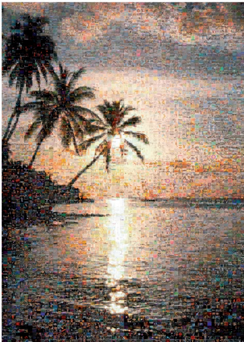
Postal de playa paradisíaca en la isla de Phuket, Tailandia, recomposta mediante un programa freeware de fotomosaico conectado on-line al buscador Google. El resultado final se compone de 10.000 imágenes disponibles en Internet, localizadas aplicando como criterio de búsqueda las palabras tsunami , ola gigante , maremoto , cataclismo , catástrofe natural , apocalipsis .