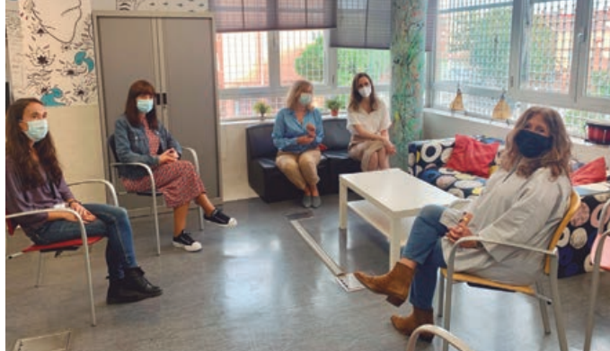
La concejal junto a trabajadoras de Protección Social.

PROTECCIÓN SOCIAL | Incorporados más profesionales