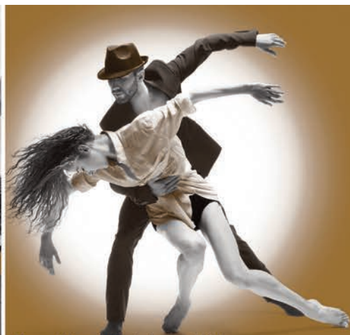
Dance Me, música de Leonard Cohen