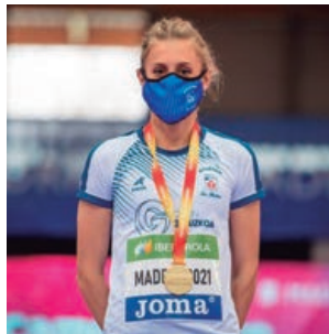
Lorea Ibarzabal, campeona de España de 800 metros