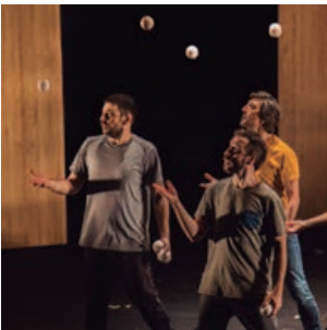
Malabares y teatro con 'Suspensión', este sábado, en el TACA