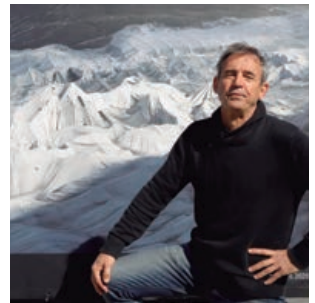
Paisajes de hielo de Fernando Moleres, en el Bulevar S. Allende