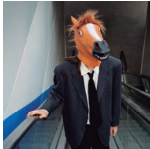
El Centro de Arte acoge 'Ficciones', de Miguel Trillo