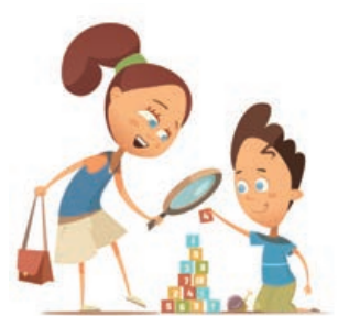
La programación de 'Cultura en Familia' para este trimestre