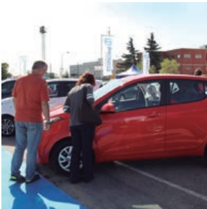
'Renovauto': del 22 al 26 de septiembre, en el recinto ferial

Más de 150 clases, 'fitness', 'spa', piscinas, medicina deportiva... y mucho más, para ponerte a punto