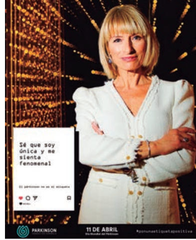
imagen social de la enfermedad y el gran desconocimiento de la población en general. El público podrá participar en el interesante coloquio en el que tres personas con párkinson, una cuidadora y una psicóloga conversarán sobre esta enfermedad y cómo afecta a la persona. Cómo comunicar esta patología, el miedo a salir a la calle, el desconocimiento y los prejuicios serán algunos ejes de esta conversación. La actividad finalizará con