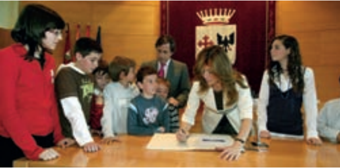
El alcalde y la concejal de Infancia, junto a los niños del consejo.

Más de 4.000 niños y niñas de Alcobendas participaron en el proceso democrático para elegir el Consejo de Infancia y Adolescencia, que se presentó oficialmente esta semana en el Salón de Plenos del Ayuntamiento.