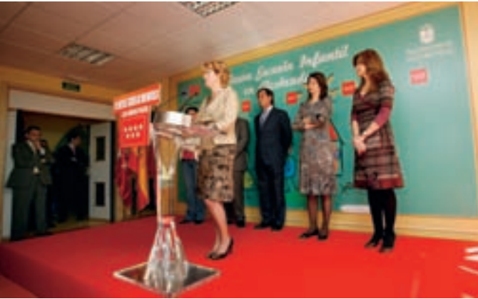
En la imagen de la izquierda, Esperanza Aguirre en la inauguración. En la fotografía de la derecha, la presidenta regional y el alcalde en un momento de la visita por escuela infantil

El alcalde de Alcobendas, Ignacio García de Vinuesa, y la presidenta regional, Esperanza Aguirre, han visitado la nueva Escuela Infantil Pío Pío, centro de titularidad autonómica cuya construcción ha supuesto una inversión de 1,7 millones de euros, asumidos por el Gobierno regional.