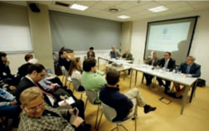
A la reunión asistieron los concejales de Medio Ambiente, Participación Ciudadana y Distrito Ensanche.

El Ayuntamiento quiere contar con la opinión de los vecinos del Distrito Ensanche para llevar a cabo la remodelación del Parque de Navarra. Tras la presentación del proyecto esta semana, los interesados pueden consultarlo hasta el 16 de abril en el Centro Cultural Pablo Iglesias.