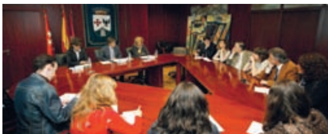
El alcalde, acompañado de las concejales de Mujer y Bienestar Social, presentó la Escuela a los medios de comunicación.

tales de la salud femenina como el estrés, embarazo, parto y menopausia, sin olvidar la importancia de la pre-