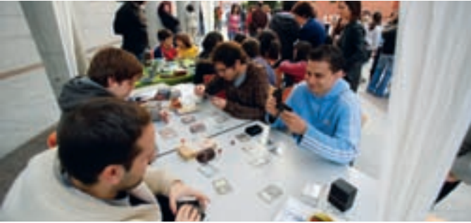
Un momento de la inauguración de 'Imagina tu Tarde' el pasado 29 de marzo.

Habrà un espacio Chill Out con la play station o con juegos de mesa. Además hay un mejor música mientras juegas espacio, Actividad Sorpresa ,