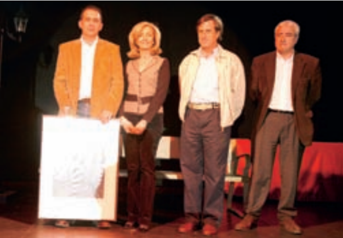
El alcalde y la concejal de Mujer entregaron el premio a la Unidad de Violencia de Género de la Policía Local.

Seiscientas personas participaron el día 29 de marzo en la fiesta del Día Internacional de la Mujer. En la celebración se entregaron los premios que anualmente se conceden a personas que se han distinguido en la defensa de los derechos de la mujer.