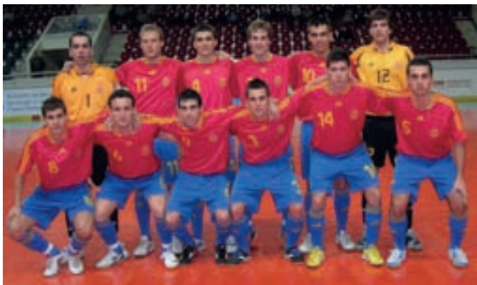
Los componentes de la selección española sub 21 de fútbol sala.

La selección española sub 21 de fútbol sala jugará en Alcobendas el Preeuropeo de la categoría del 10 al 13 de abril, en el pabellón B del polideportivo José Caballero.