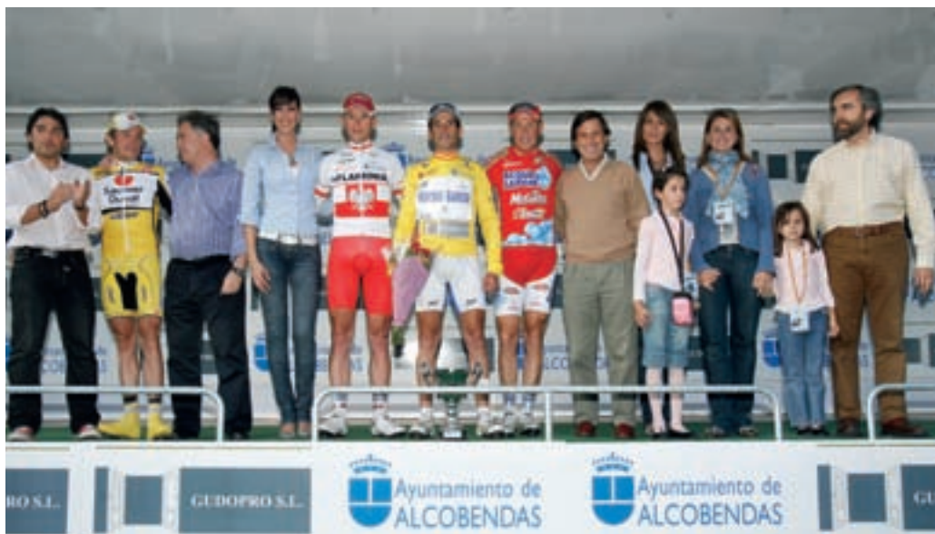
El alcalde y el concejal de Deportes en la entrega de trofeos junto con los ganadores.

EN UNA ETAPA MARCADA POR LA LLUVIA Y EL MAL TIEMPO