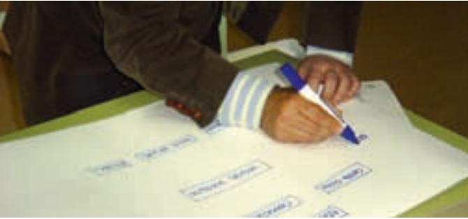
Los vecinos elaboraron esquemas de trabajo en los diferentes ámbitos.

Finalizadas las sesiones, en las que han participado un total de 138 vecinos, el Ayuntamiento ha recopilado las propuestas que han planteado los vecinos y que, entre otras cuestiones, establecen los espacios de participación ciudadana en los ámbitos estratégico, territorial y sectorial.