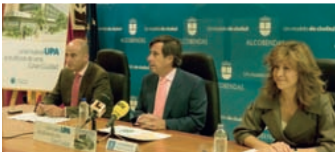
El alcalde y los concejales de Urbanismo y Educación en la presentación del proyecto a los medios de comunicación.

La Universidad Popular de Alcobendas se ha quedado pequeña para las necesidades de la ciudad y en su actual ubicación no puede crecer. El Ayuntamiento construirá una gran Universidad Popular en Fuente Lucha y será un edificio singular con las infraestructuras necesarias para cubrir las demandas educativas del siglo XXI.