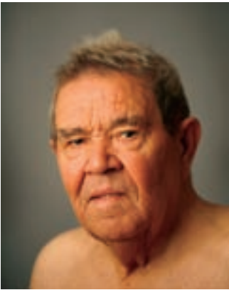
'Faustino', de Rafael Paniagua.

El segundo grupo de artistas becados por el Ayuntamiento de Alcobendas en 2007 expondrá a partir del 23 de junio sus proyectos. El Centro Cívico Anabel Segura acogerá hasta el 23 de julio la muestra con obras de un pintor y cuatro fotógrafos.