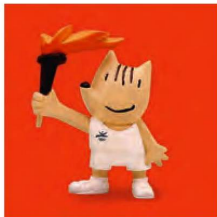
Abajo, la mascota Cobi, el póster de la película 'Chico y Rita' y la escultura de la playa de La Pineda.