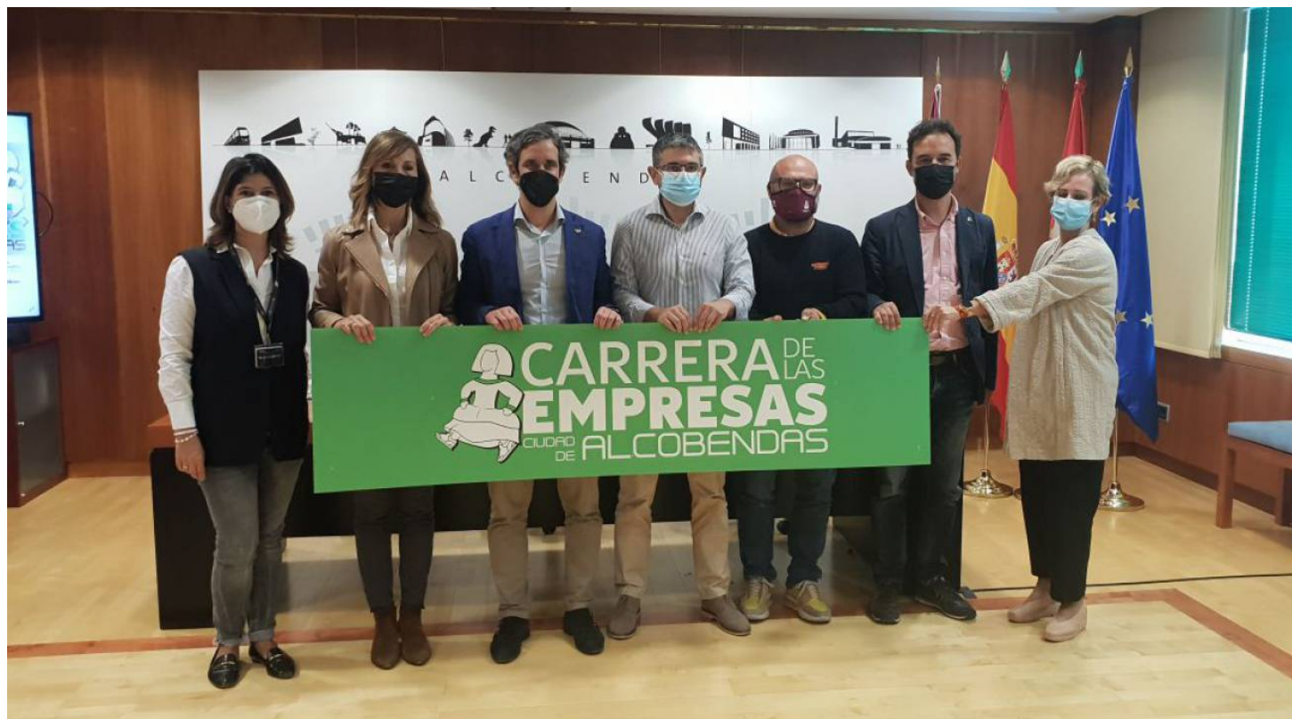
Presentación III Carrera de las Empresas Ciudad de Alcobendas / SER Madrid Norte

Ya están abiertas las inscripciones de la prueba que se celebrará el 7 de noviembre en el polideportivo José Caballero