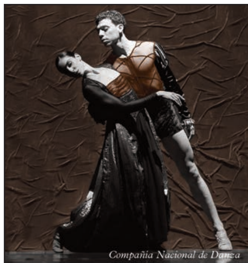
Compañía Nacional de Danza

Castelvines & Montesés. Los amantes de Verona según Lope de Vega