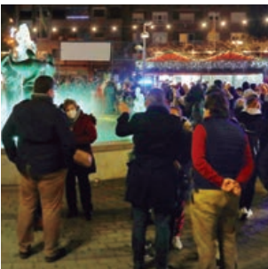
Alcobendas estrena la Navidad en el Parque de Cataluña

El Presupuesto Municipal para 2022 asciende a 201 millones de euros y destina 37 millones a inversiones