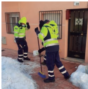
Activado el 'Plan de Intervención ante Nevadas'