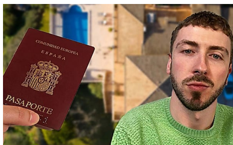
Madrid: No vendas tu casa en Alcobendas hasta que hayas leído esto Experts In Money