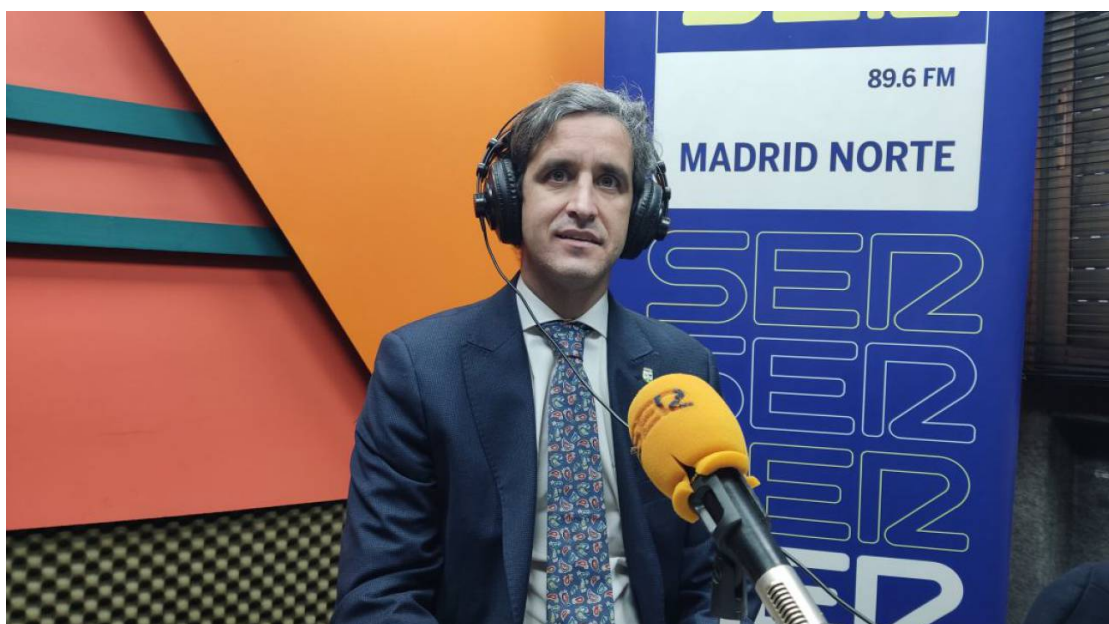
El alcalde de Alcobendas, Aitor Retolaza en los estudios de SER Madrid Norte

El regidor ha repasado en Hoy por Hoy los proyectos más importantes para este 2022 entre los que destaca la remodelación del Distrito Centro