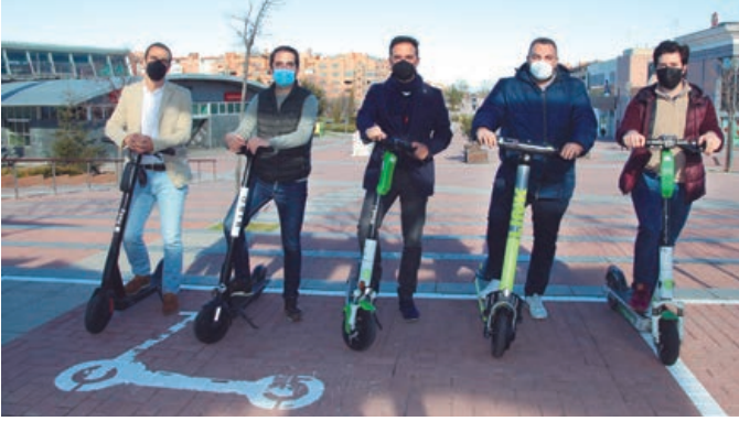
El concejal de Movilidad, junto a los representantes de las empresas firmantes del acuerdo.

CIUDAD | Una iniciativa sostenible y eficiente