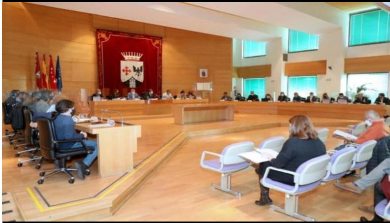
Pleno del Ayuntamiento de Alcobendas

El proyecto aprobado por el Gobierno de PSOE y Ciudadanos también incluye la sustitución de la iluminación por bombillas LED