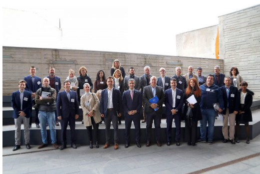
Foto de los asistentes al acto de Bienvenida a las nuevas

Además de agradecer a los presentes su elección de Alcobendas como sede de sus diferentes actividades empresariales, el consistorio busca con este tipo de encuentros la posibilidad de crear puntos de encuentro y networking para dar lugar a sinergias entre las empresas.