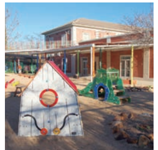
Jornadas de puertas abiertas en las escuelas infantiles