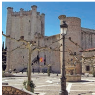
Se activan las excursiones para personas mayores