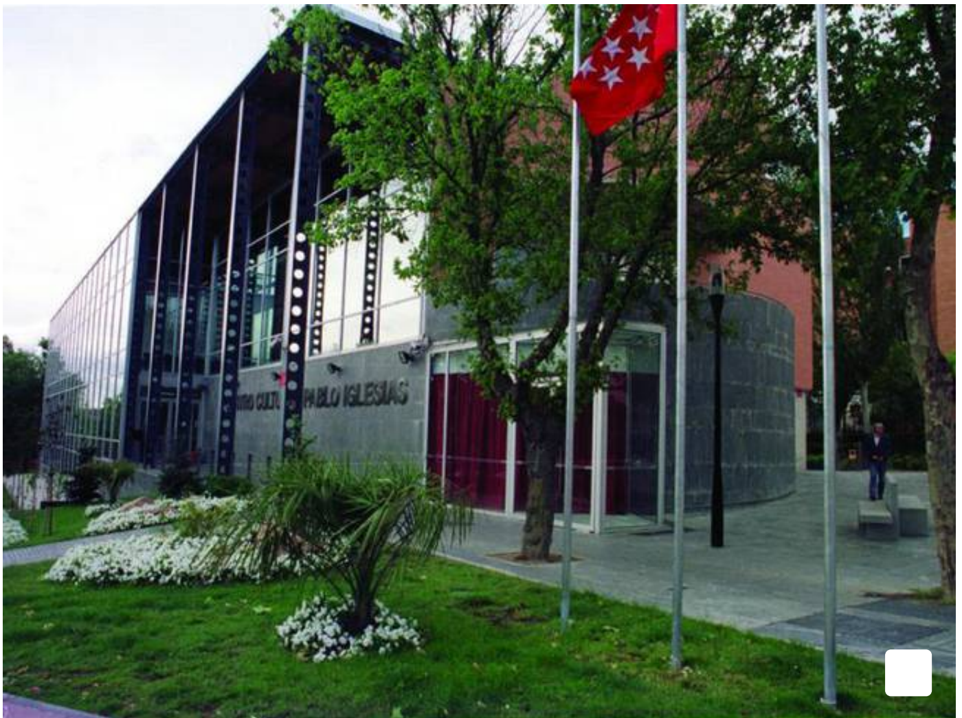
Centro Cultural Pablo Iglesias de Alcobendas

El centro lleva dos décadas proporcionando a los vecinos literatura, ocio, educación, información y conocimiento