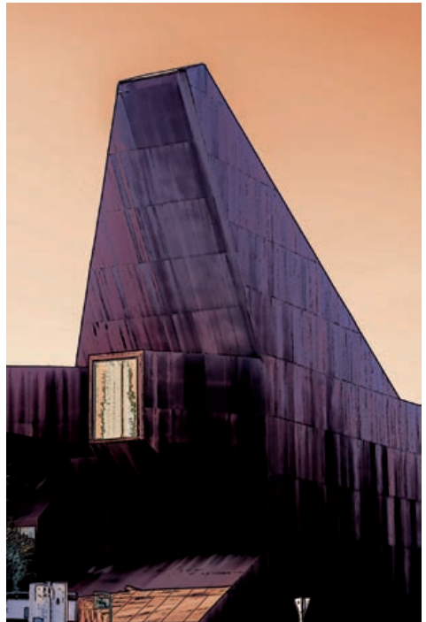
De arriba a abajo: © Ana Valdés 5º y © Javier López Benito.