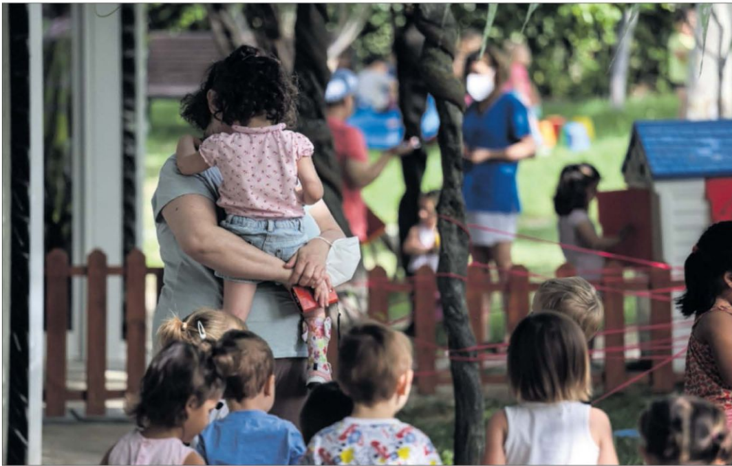
La escuela infantil Valdelaparra, en Alcobendas, ayer.

El municipio madrileño ofrece atención educativa a casi todos los niños de hasta cuatro años. Pozuelo de Alarcón y Granada le siguen de lejos