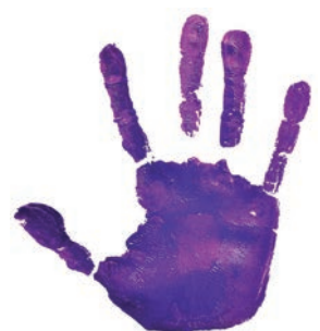
Súmate al 'Pacto por el Fin de la Violencia contra la Mujer'