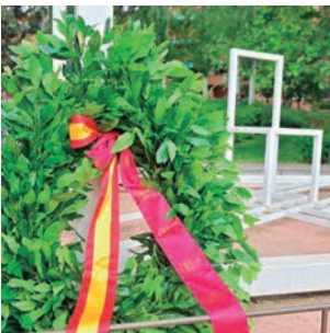
Alcobendas rinde homenaje a Miguel Ángel Blanco

Todo preparado para disfrutar, tras el verano, de una gran oferta cultural