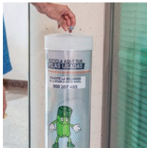
Instalados 71 nuevos contenedores de pilas usadas