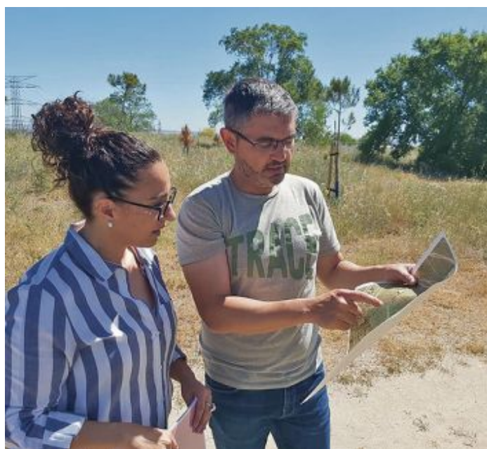
El vicecalde, junto a la concejal de Medio Ambiente

Los terrenos donde se ubicaba años atrás el antiguo vertedero se convertirán próximamente en un gran parque forestal. Este es uno de los proyectos más ambiciosos en materia medioambiental que afronta Alcobendas y gracias al cual contará con un extenso pulmón verde de 185.000 metros cuadrados, un área verde que se convertirá en un espacioso parque forestal que fomentará la biodiversidad y será un sumidero de carbono gracias a la plantación de 22.000 árboles, según aseguran fuentes municipales. Esta reconversión se llevará a cabo, en parte, gracias a una subvención de 3,6 millones de euros de la Fundación Biodiversidad del Ministerio de Transición Ecológica, procedente de los Fondos Europeos Next Generation.