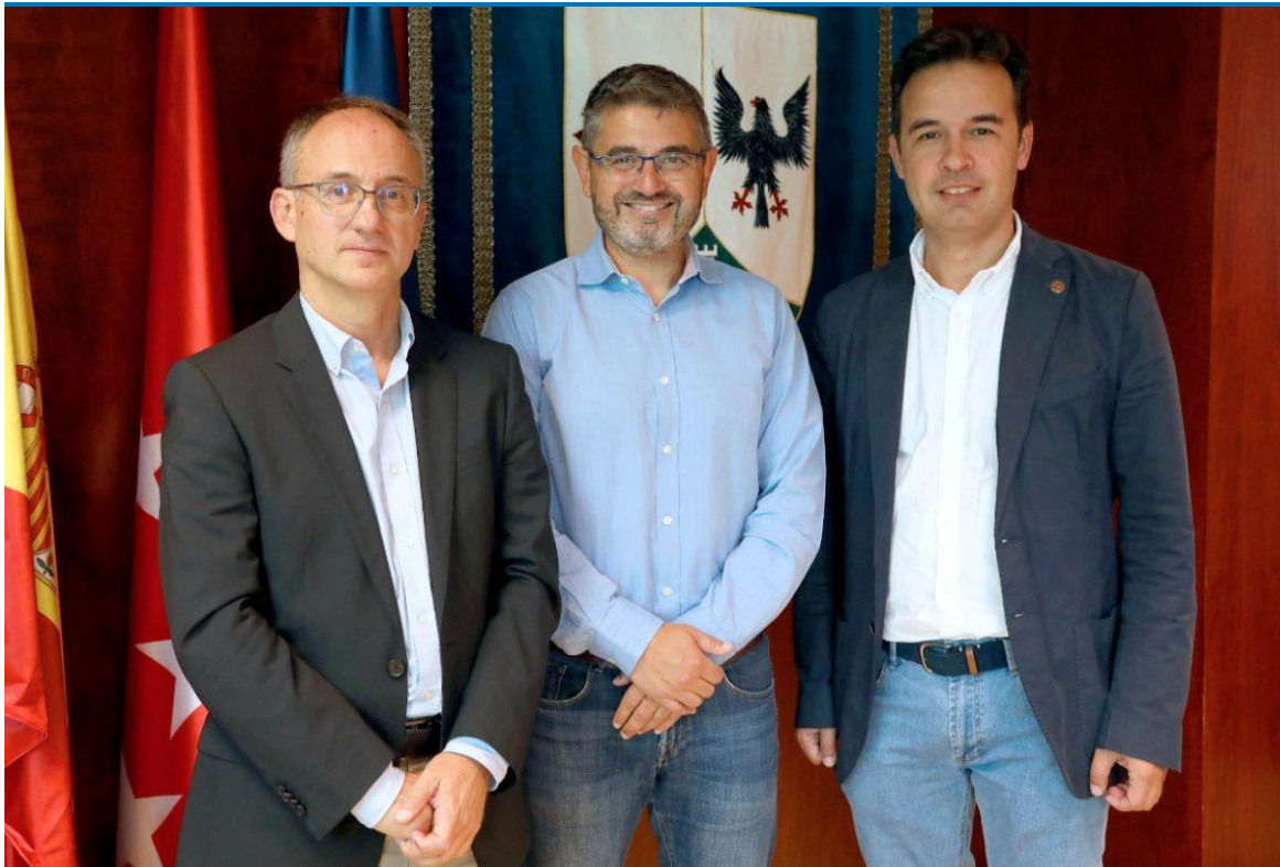
Ambas entidades llegaron a un acuerdo que beneficia a nuestro municipio.