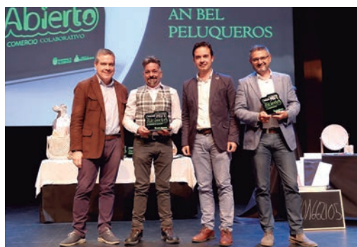
'Premio Comercio Colaborativo': An Bel Peluqueros.