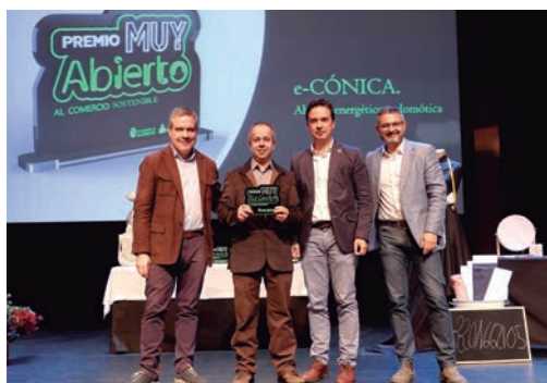
'Premio Comercio Sostenible': e-Cónica.

El Ayuntamiento de Alcobendas quiere destacar y agradecer la colaboración desinteresada en la gala de los Premios Muy Abierto a los socios de la Asociación La Menina; a La Cubeta, Espacio Creativo, por la realización y edición del vídeo de presentación; y a Eme de Mariposa, Floralbir y Da Rúa Panadería, por aportar parte del atrezzo del escenario.