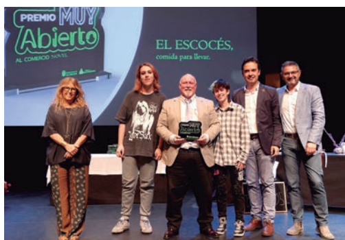
'Premio Comercio Novel': El Escocés, Comida para llevar.