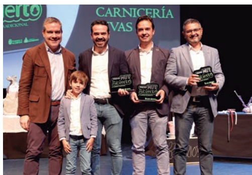
‘Premio Comercio Tradicional’: Carnicería Rivas.