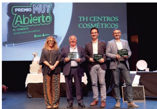
'Premio Comercio Generador de Empleo': TH Centros Cosméticos