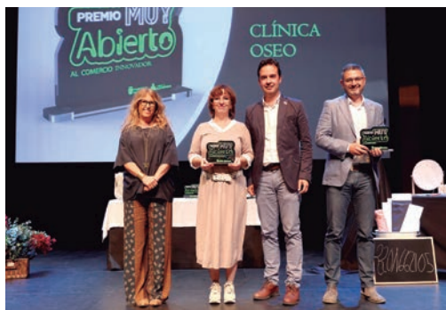
'Premio Comercio Innovador': Clínica Óseo.