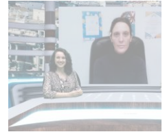
¿Qué ha preparado Parla

LEE TODAS LAS NOTICIAS DE NUESTRAS CIUDADES