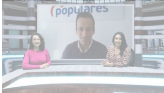
El PP de Getafe se pronuncia sobre la Ley del 'solo sí es sí'