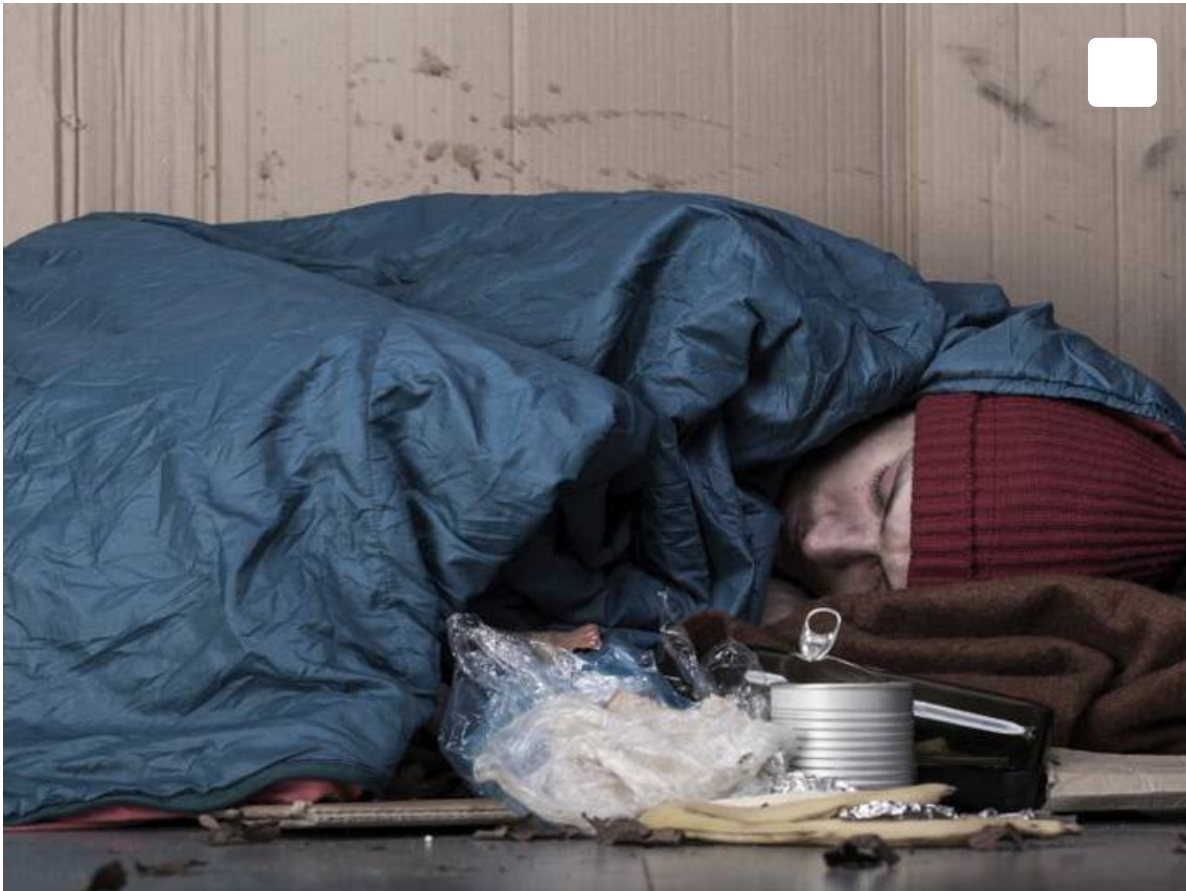
Persona sin hogar

El Ayuntamiento ha puesto en marcha la “Campaña de protección del frío” para paliar las bajas temperatura y las dificultades derivadas del encarecimiento de los costes de la vida