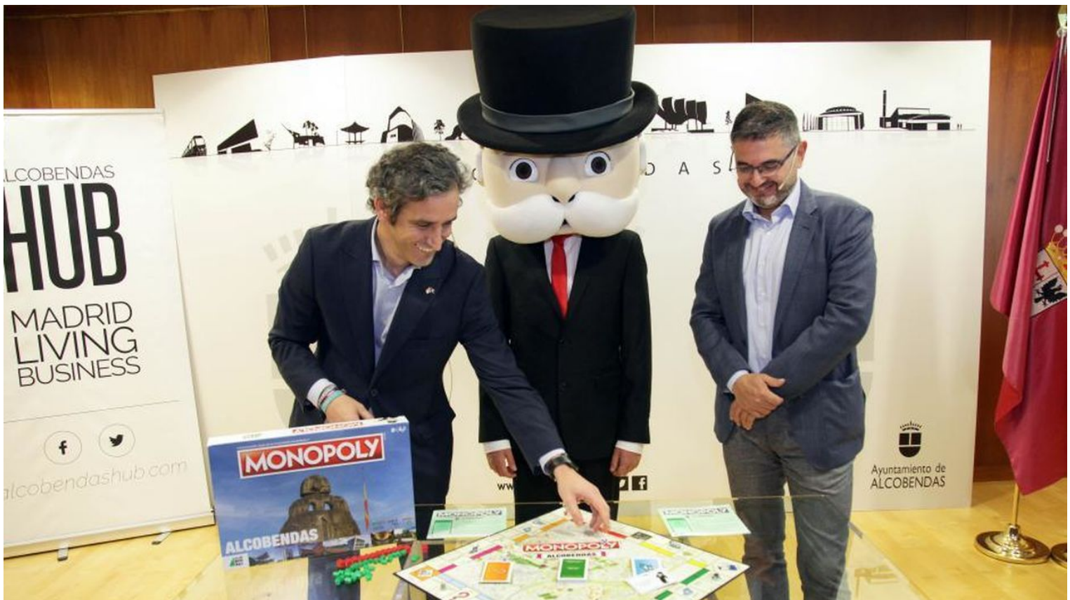
Presentación del Monopoly de Alcobendas | AYUNTAMIENTO DE ALCOBENDAS

Se ha convertido en la primera ciudad de la Comunidad de Madrid, que, tras la capital de España, cuenta con una edición propia del Monopoly