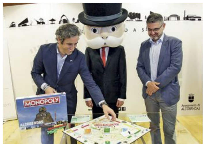
Presentación de la edición del Monopoly de Alcobendas

En el caso de la Comunidad de Madrid, solo la capital contaba con una edición del Monopoly que integrara sus calles más emblemáticas. Hasta ahora. Este pasado miércoles se presentaba la edición propia de Alcobendas, lo que permite a la localidad del Norte de la región sumarse a un listado selecto donde están Roma, Londres, Nueva York, Córdoba y Granada.