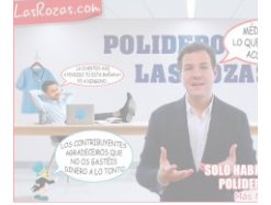
"Su forma de gobernar es de maquillaje por encima necesidades".

LEE TODAS LAS NOTICIAS DE NUESTRAS CIUDADES