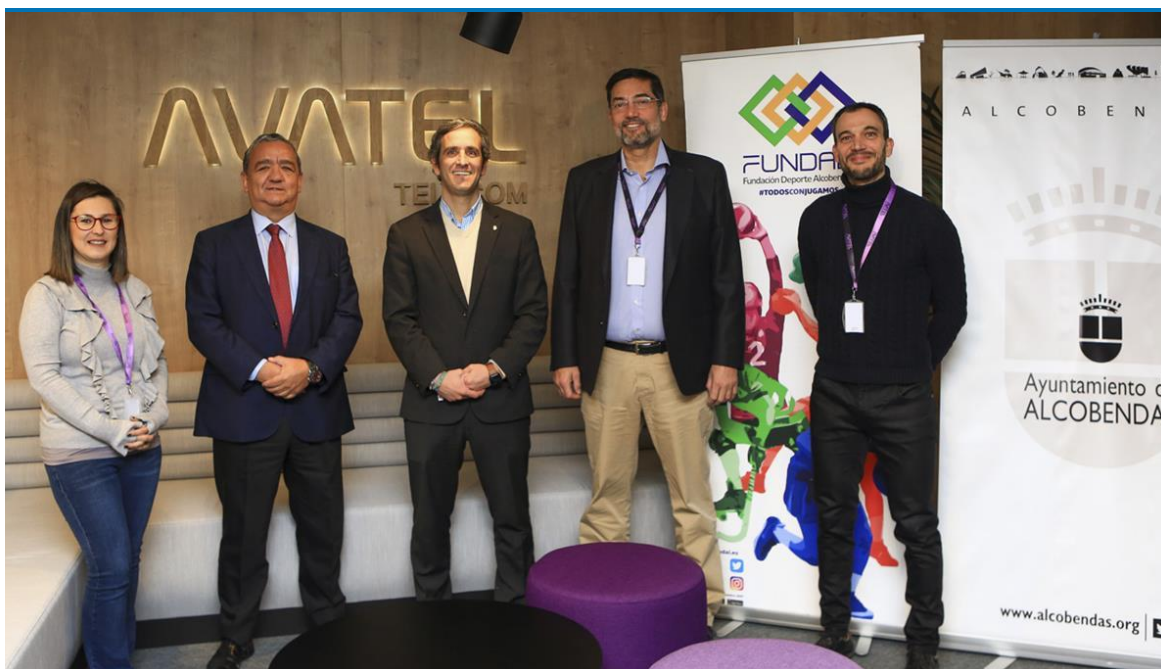
avatel, fundal, convenio, colaboración, deporte

Renuevan el convenio de colaboración para la promoción y desarrollo del deporte y hábitos saludables