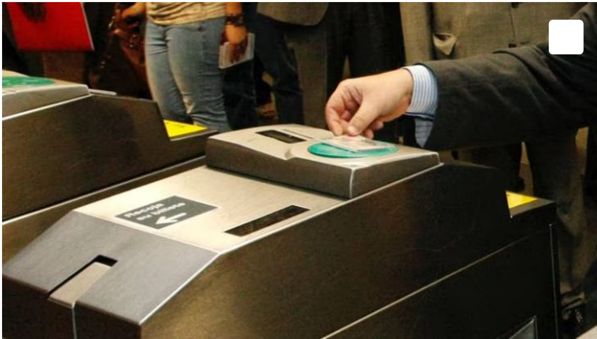
Tajeta de Transporte Público en la estación de Cercanías de Alcobendas-San Sebastián de los Reyes / Comunidad de Madrid

El Consistorio va a instar a la Comunidad de Madrid a reordenar las líneas de autobuses, a reducir la carga económica para los usuarios y a adoptar un modelo que tenga en cuenta a las localidades de los alrededores de la capital