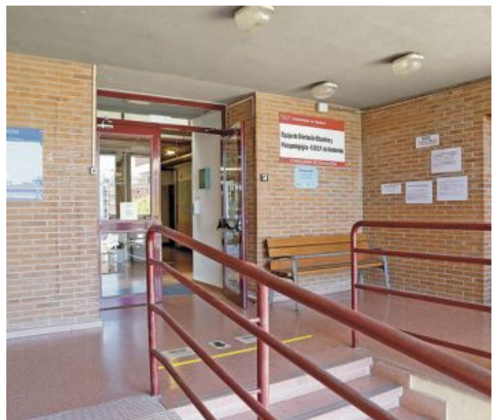
Dependencias del Centro Psicopedagógico Municipal

La tutoría está orientada a aquellos alumnos y alumnas de 2º y 3º de ESO que puedan tener dificultades para superar el curso o que tienen