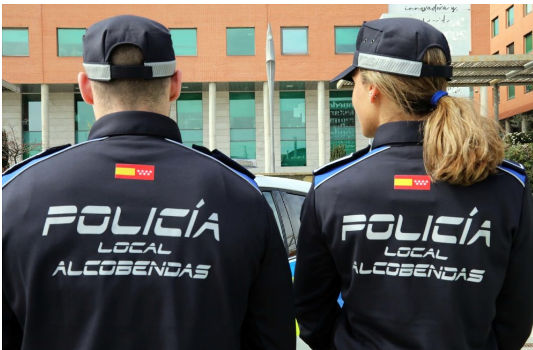
Nuevos uniformes de la Policía Local de Alcobendas.

Los nuevos uniformes de la Policía Local del municipio son una apuesta pionera en todo Madrid. Los agentes del cuerpo van a vestir estos nuevos trajes, elaborados con botellas recicladas e iones de hidrógeno que alargan la vida útil de las prendas y las convierten en “anti-olor”.