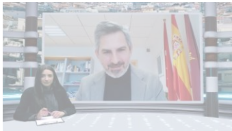
"Madrid está a la cabeza de España y Europa en prevención de violencia sexual".