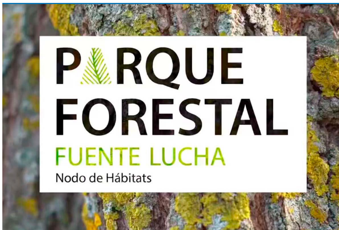
Cartel del parque forestal.

El plan pretende capturar más de 7.300 toneladas de CO2, emitidas por los coches en un año