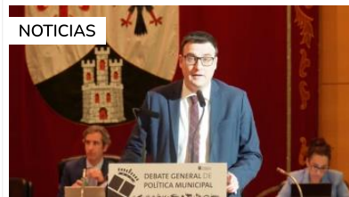
Alcobendas Arranz denuncia que no se apruebe ninguna de sus enmiendas