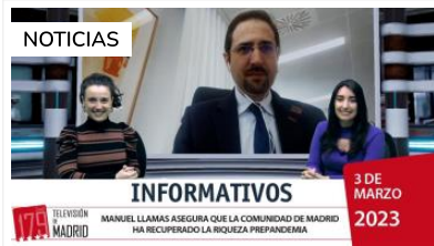
Regional Informativo 3 de marzo