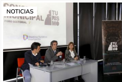
Alcobendas ¡Alcobendas busca turistas!