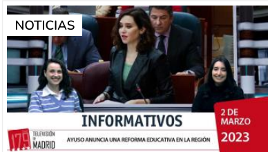
Regional Informativo 2 de marzo