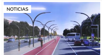
Alcobendas Convertir la M-603 en... ¿una Gran Vía sin restaurantes ni teatros?