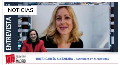
Alcobendas García Alcántara: "Queremos que el vecino se sienta seguro y protegido"