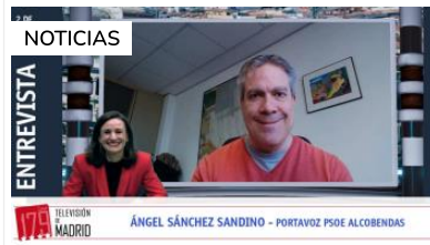
Alcobendas Sánchez Sanguino: "Es un plan muy ambicioso pensado para distintas legislaturas"