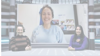
¿Qué ocurre con la carrera del Día de la Mujer?