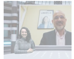
El Partido Popular pone e sueldos de la corporación

¡Conoce toda la información local y regional!