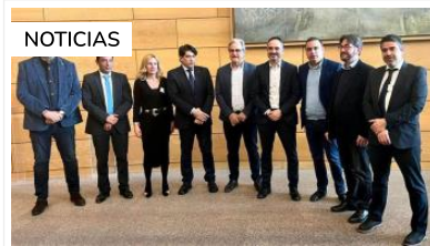
Alcobendas PP Alcobendas lleva una petición a la Asamblea de Madrid