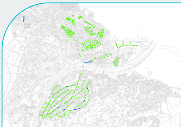
Nuevas zonas para residentes