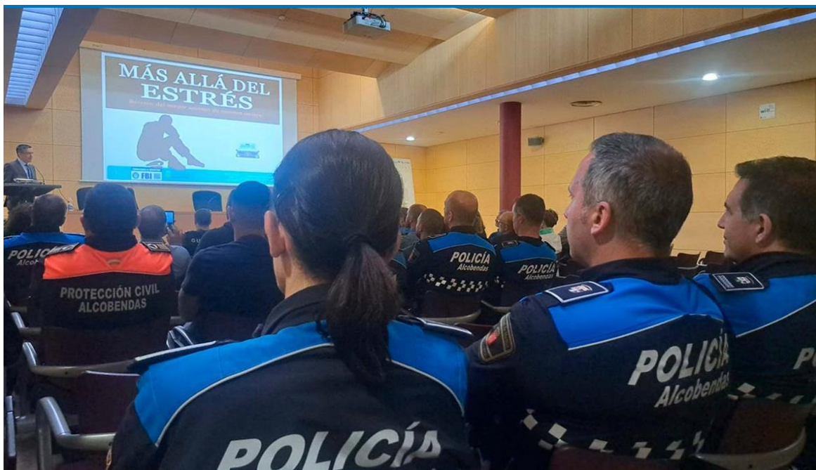
Programa de Ayuda al Empleado (PAE) de Affor Health.

El proyecto buscará potenciar el bienestar emocional y la salud mental de todos y cada uno de los policías locales del municipio