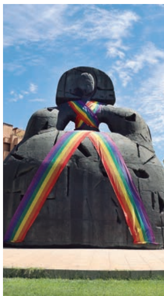
La Menina y la fuente de la Estación lucieron los colores del arco iris con motivo del Día Internacional del Orgullo LGBTI.