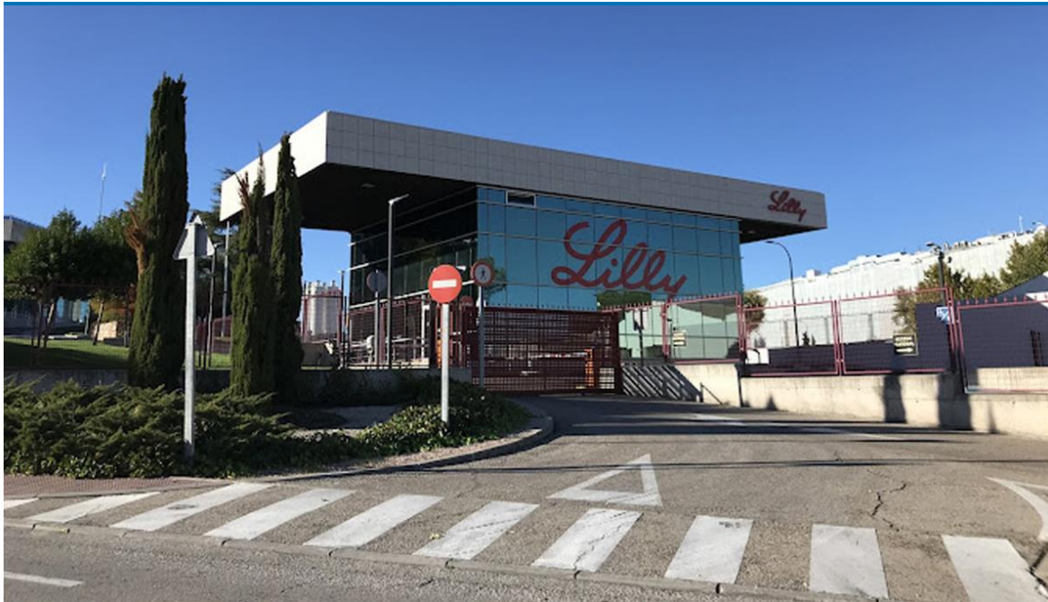
Centro de I+D ubicado en Alcobendas.