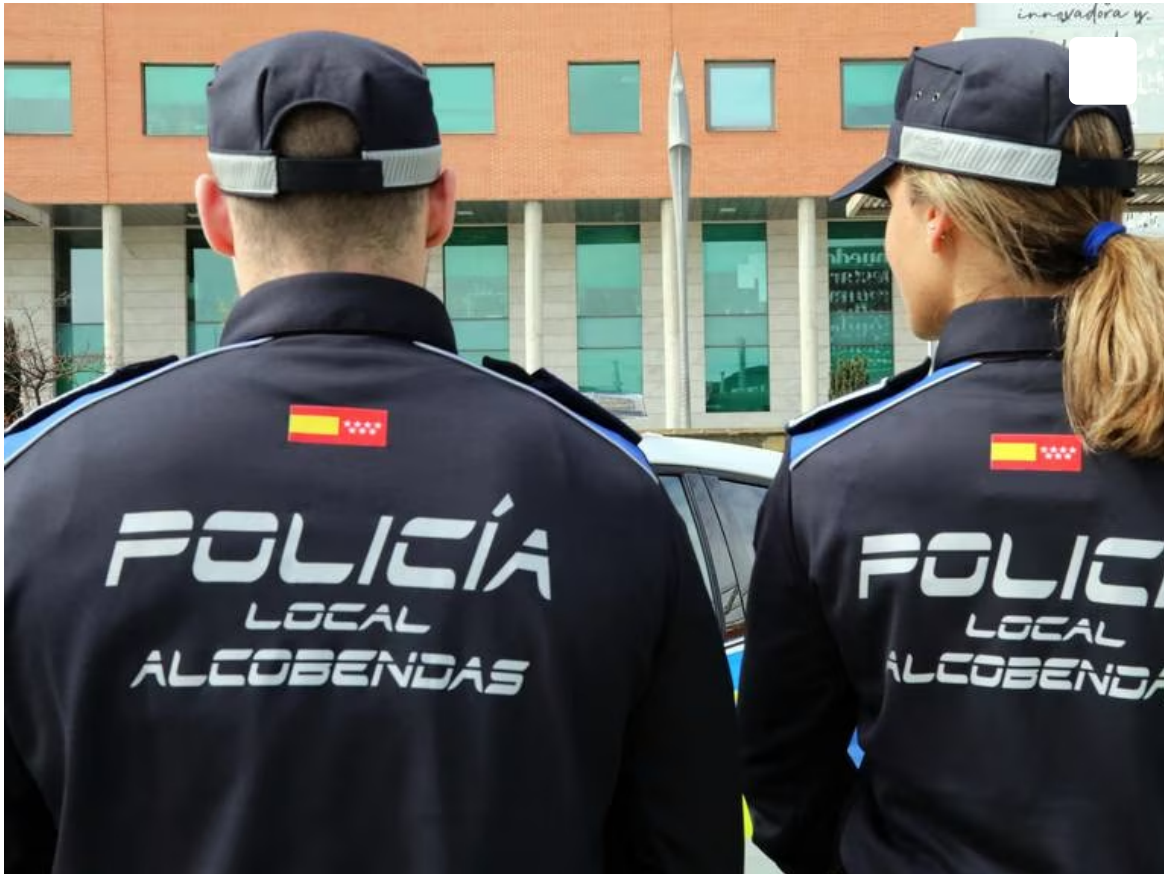
Agentes de la Policía Local de Alcobendas

Se pretenden minimizar especialmente los robos en viviendas y establecimientos, cuando sus dueños se encuentren de vacaciones fuera de la ciudad