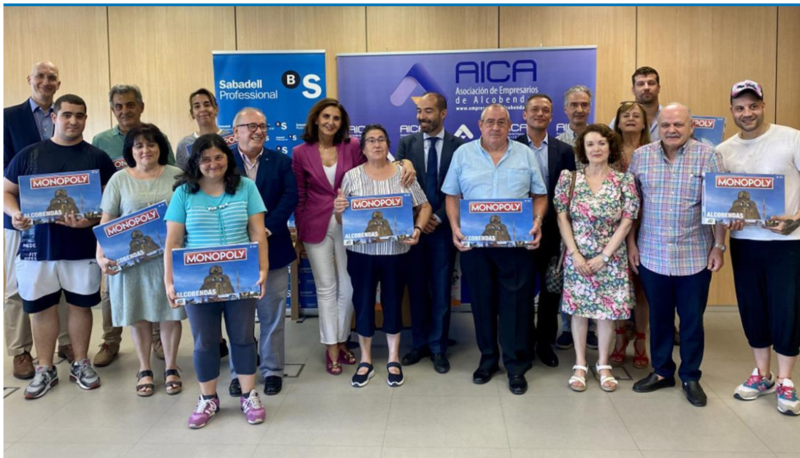
Monopoly local.