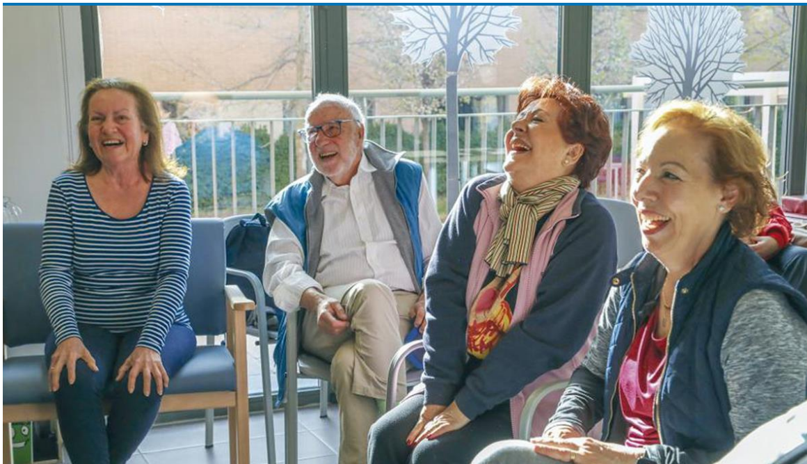
Taller de risoterapia en Alcobendas.

El centro de mayores 'Pedro González Guerra' acoge el taller de risoterapia