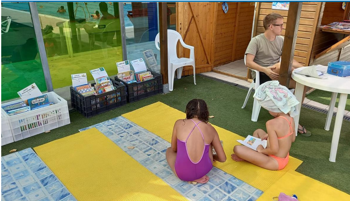
Bibliopiscinas y ocio acuático.

Vuelve a Alcobendas una de sus propuestas más veraniegas