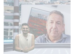
Entrevista a Francisco Jo Primer Teniente de Alcalde de Cultura y Ciudad.